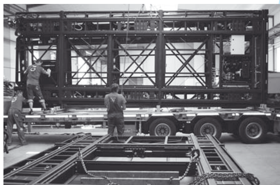
Nakládání hotových jevištních výrobků vyžadovalo zkušenost a přesnost

až do 2. podzemního podlaží. Vámi vyrobené pomocné jevištní vozy mohou být různě spojovány dohromady a mohou tak vytvořit menší nebo větší hrací plochu. Může jich zůstat dvanáct menších samostatných, nebo mohou být zformovány ze dvou či tří vozů do většího jeviště. Tyto tři vozy pak tvoří jedno „velké jeviště“. Seskládaná velká jeviště ze tří pomocných jevištních vozů mohou být pak jen čtyři. Tři vozy tvoří vlastní hrací plochu na jevišti, tři jsou ve sklepě a připravují se na nich nové dekorace, zbylé dvě trojice vozů jsou „zaparkovány“ s postavenými dekoracemi na bočních jevištích – vedle hlavní hrací plochy. Jevištní scéna se tak obměňuje každý večer. Ve stejnou chvíli mohou být připraveny scény pro tři hry, a když jedna skončí, okamžitě sjede dolů a připravuje se na ní scéna pro další hru. Takže je velmi důležité, aby tyto systémy pracovaly správně a bezchybně, a proto jsme opět oslovili vaši společnost.