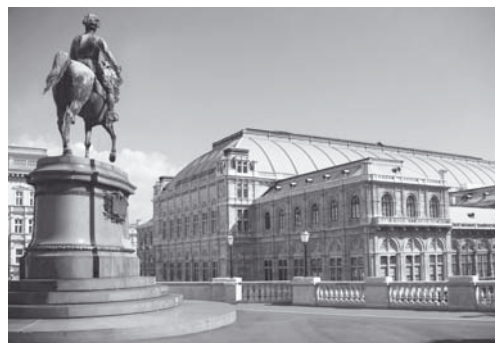
Práci našich šikovných řemeslníků ocení i návštěvníci Vídeňské státní opery

až do 2. podzemního podlaží. Vámi vyrobené pomocné jevištní vozy mohou být různě spojovány dohromady a mohou tak vytvořit menší nebo větší hrací plochu. Může jich zůstat dvanáct menších samostatných, nebo mohou být zformovány ze dvou či tří vozů do většího jeviště. Tyto tři vozy pak tvoří jedno „velké jeviště“. Seskládaná velká jeviště ze tří pomocných jevištních vozů mohou být pak jen čtyři. Tři vozy tvoří vlastní hrací plochu na jevišti, tři jsou ve sklepě a připravují se na nich nové dekorace, zbylé dvě trojice vozů jsou „zaparkovány“ s postavenými dekoracemi na bočních jevištích – vedle hlavní hrací plochy. Jevištní scéna se tak obměňuje každý večer. Ve stejnou chvíli mohou být připraveny scény pro tři hry, a když jedna skončí, okamžitě sjede dolů a připravuje se na ní scéna pro další hru. Takže je velmi důležité, aby tyto systémy pracovaly správně a bezchybně, a proto jsme opět oslovili vaši společnost.